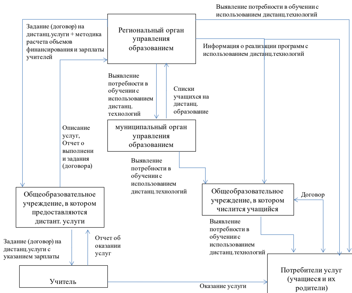
Рис. 3. Модель, при которой сигнал о потребности в использовании дистанционных технологий и выбор поставщика услуг осуществляется «сверху» (органами управления образованием).

Отметим, что на рисунке 3 представлена схема, при которой обучение с использованием дистанционных технологий осуществляется в интересах лиц, обучающихся в разных образовательных учреждениях (при этом одно из них является для учащегося основным (здесь он числится), так как в нем он получает образовательные услуги в традиционной форме, без использования дистанционных технологий). Аналогичная схема может иметь место для ситуации обучения учащихся, не привязанных к конкретному образовательному учреждению, - в данном случае пропадает звено «общеобразовательное учреждение, в котором числится учащийся», муниципальный орган управления образованием взаимодействует непосредственно с учащимися.