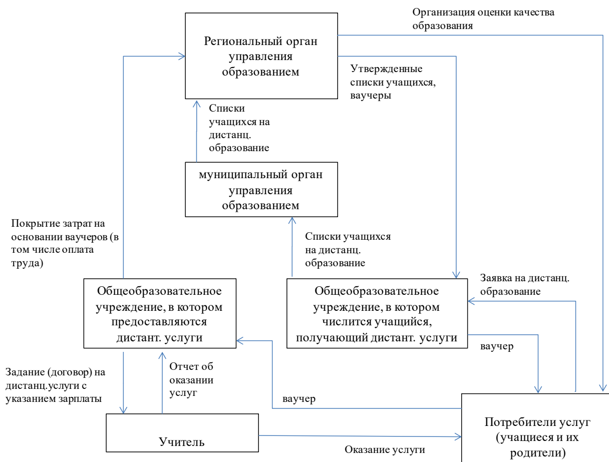
Рис. 2. Модель, при которой сигнал о потребности в использовании дистанционных технологий и выбор поставщика услуг осуществляется «снизу».

Отметим, что на рисунке 2 представлена схема, при которой обучение с использованием дистанционных технологий осуществляется в интересах лиц, обучающихся в разных образовательных учреждениях (при этом одно из них является для учащегося основным (здесь он числится), так как в нем он получает образовательные услуги в традиционной форме, без использования дистанционных технологий). Аналогичная схема может иметь место для ситуации обучения учащихся, не привязанных к конкретному образовательному учреждению, - в данном случае пропадает звено «общеобразовательное учреждение, в котором числится учащийся», и заявка на обучение с использованием дистанционных технологий поступает от учащегося в муниципальный орган управления образованием,